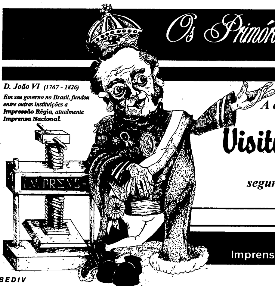
D. João VI (1767 - 1826)

Em seu governo no Brasil, fundou entre outras instituições a Imprensa Régia, atualmente Imprensa Nacional.